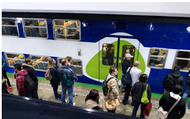
À la gare du Nord, à Paris, en octobre 2016